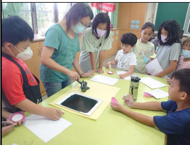
講師指導版畫技巧