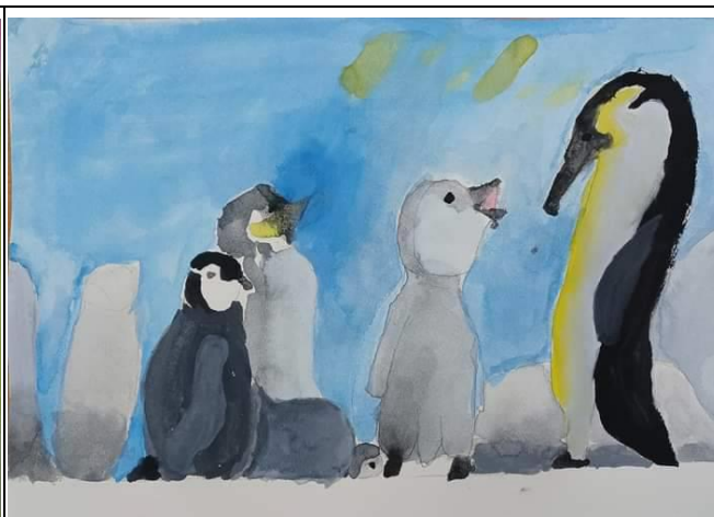
學生的作品能讓人感到溫馨的氛圍