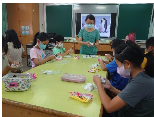
運用紙黏土製作企鵝杯模