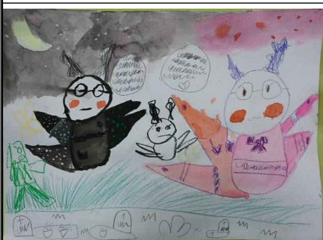
在畫作中學習動作情緒的表達