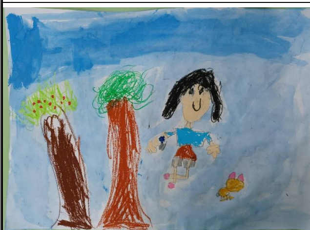
蠟筆與水彩運用，創作美麗的藝術作品。