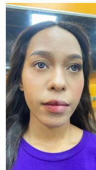
臉型修飾講解示範