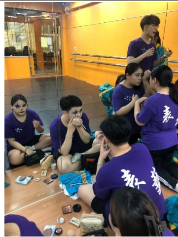
學員實操練習小丑妝容