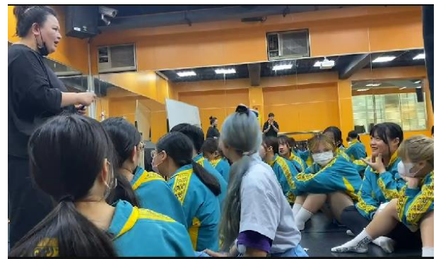
學員臉型修飾講解