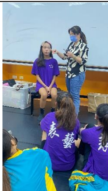
臉型修飾講解示範