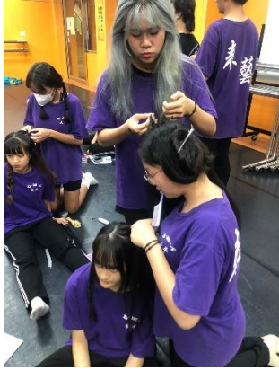
學員髮型實操練習