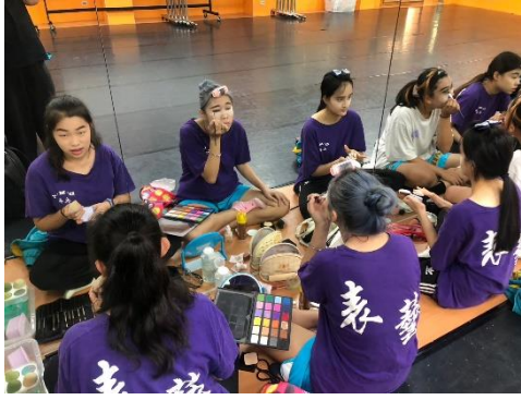
學員妝容實操練習