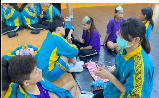
學員妝容實操練習