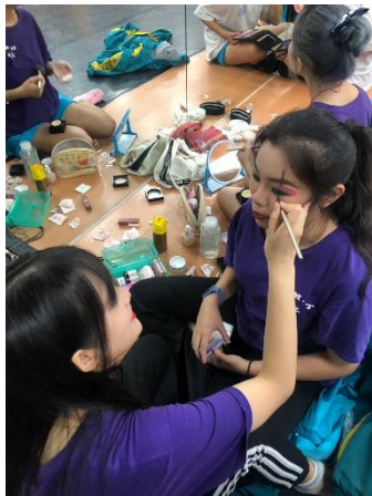
學員實操練習小丑妝容