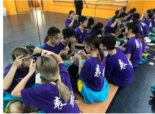
學員妝容實操練習