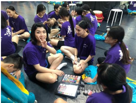
學員彩妝實操練習