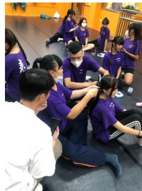
學員髮型實操練習