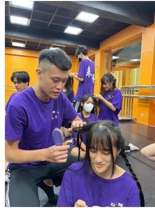
學員髮型實操練習