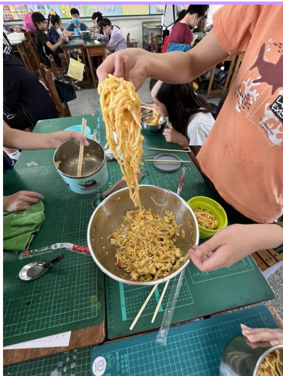
全班師生專心聆聽學生講解