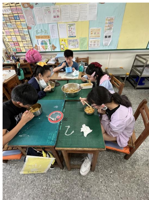
針對外來物種的議題