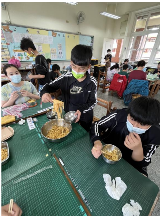
人類活動對環境的影響