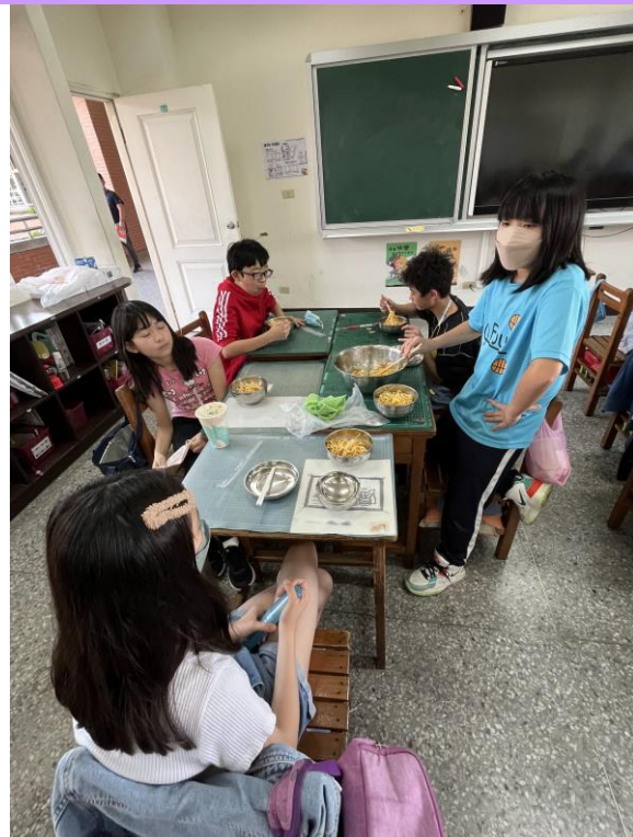
人類活動改變自然環境