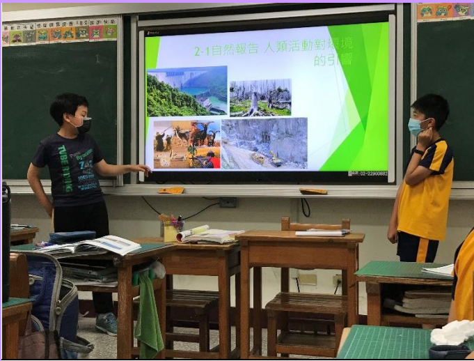
學生上網蒐集相關照片來介紹