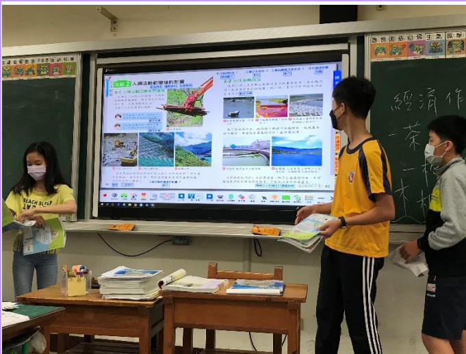
每一個主題都是一個團隊的作品