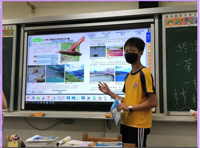
講解與環境相關的災害