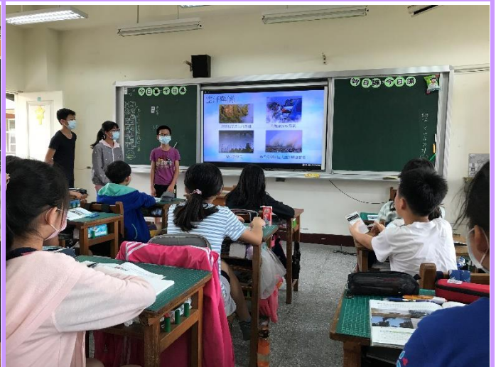
台下的學生認真的聽講